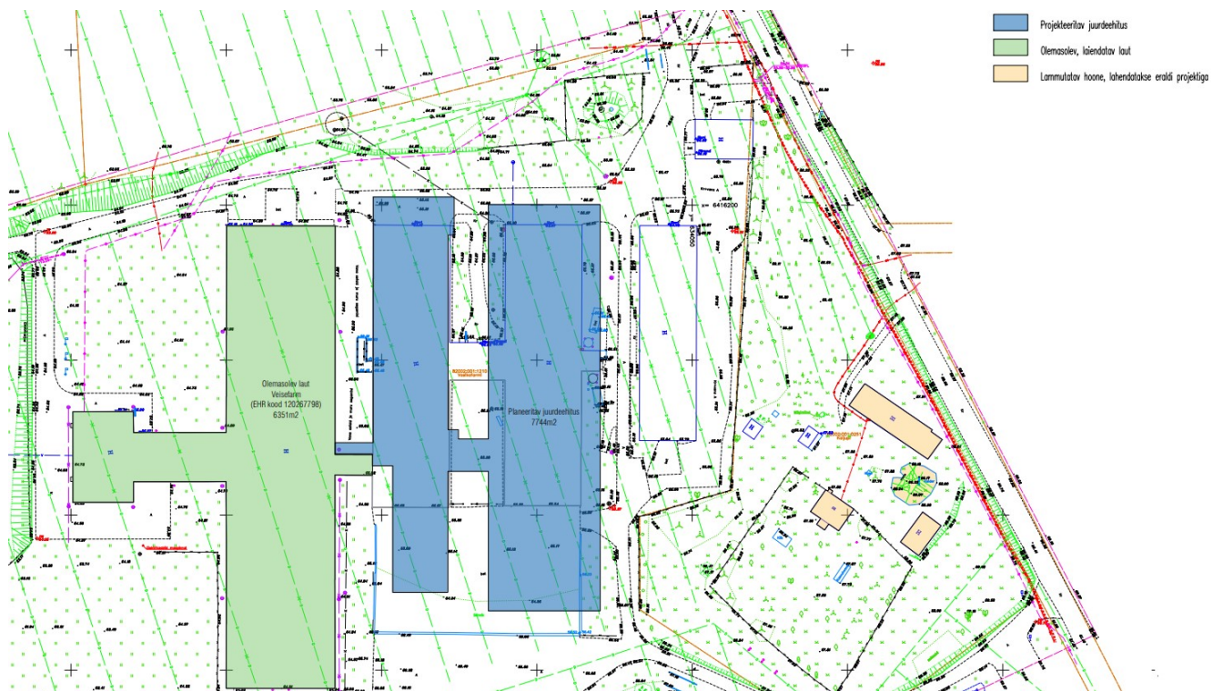
Joonis 1. Kavandatava ala eskiis

Laudahoone juurdeehitus on vajalik, kuna olemasolev lüpsiplatsi lahendus on ajale jalgu jäänud ning hooneosa on oluliselt amortiseerunud. Uude lüpsikaruselli tiiba on ette nähtud töötajatele suurem riietusruum, juhtimisruum ja veterinaararstile oma tööruum. Osaliselt on olmeruumide plokk kavandatud kahekorruselisena.